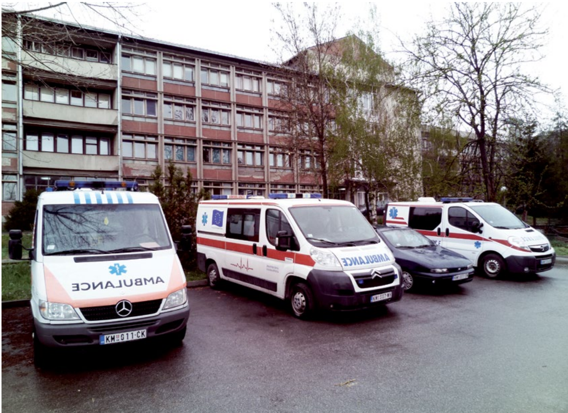
Mjekët duke punuar në spital në veriun e Mitrovicës kanë konstatuar një rritje të shkallës së lindjes të Serbëve të Kosovës.