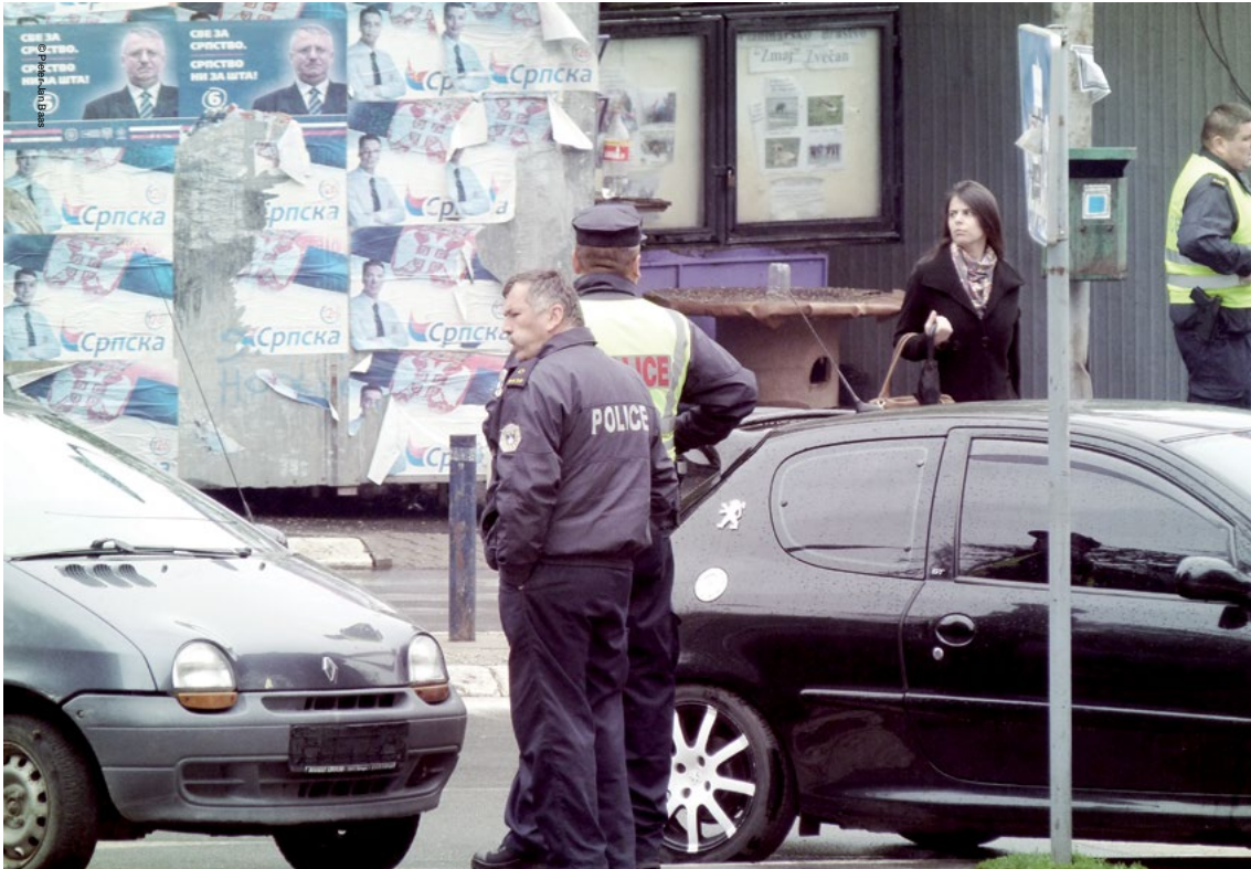
Integrimi i pjesëtarëve të Policisë së Ministrisë së Punëve të Brendshme të Serbisë në Policinë e Kosovës mund të përmirësojë zbatimin e sundimit të ligjit në veri të Kosovës.