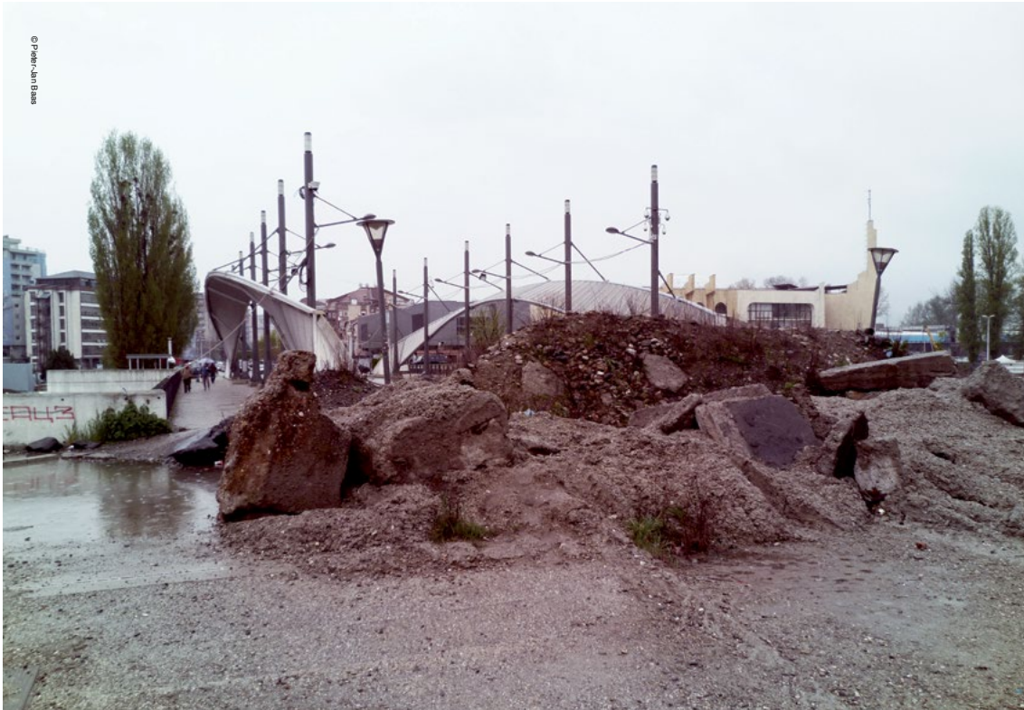
Barrikada mbi urën kryesore në Mitrovicë sjell përkujtim për ndarjen me të cilën njerëzit në Mitrovicë kanë jetuar 14 vite.

publik dhe heqjes dorë e cila, së paku nëse nuk ndërpritet, do të mban Kosovën në një situatë pa rrugëdalje në aspektin ekonomik dhe politik.