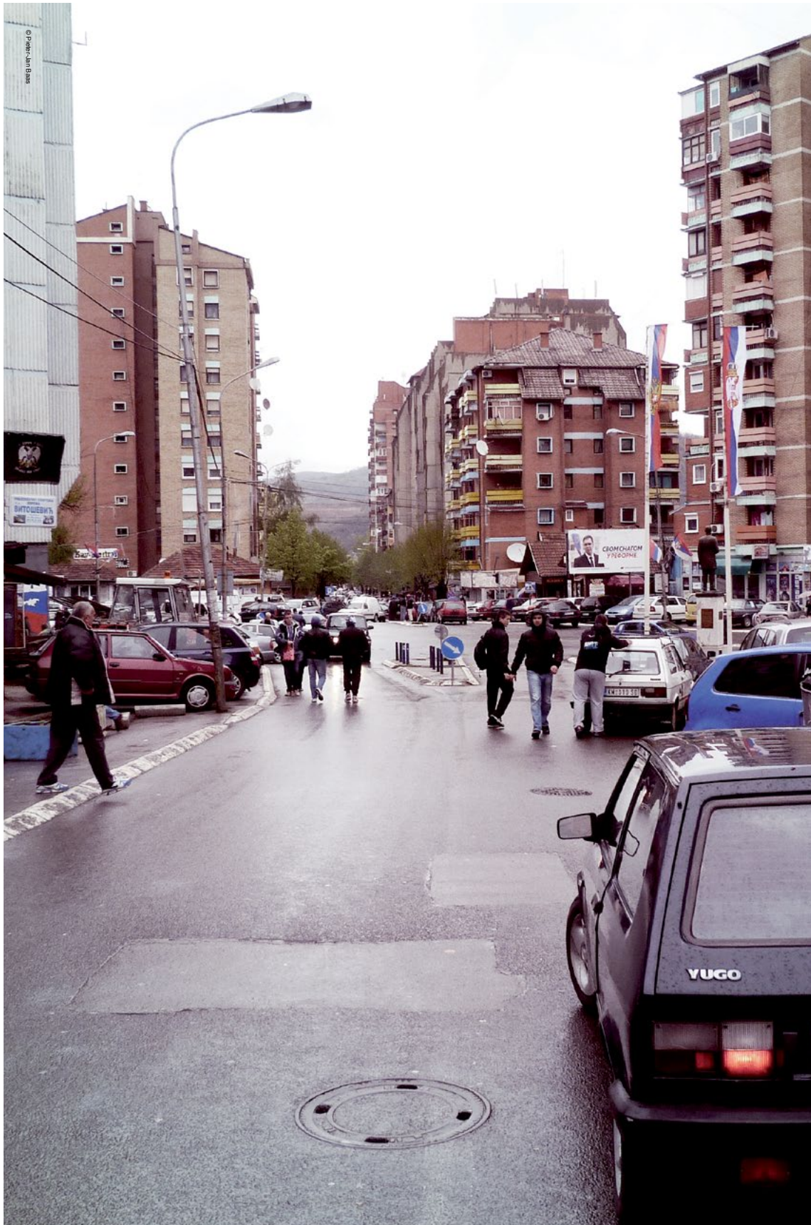
Rruga kryesore në veri të Mitrovicës: Përveç të gjitha ndryshimeve politike, shumë Serbë në veri të Kosovës shpresojnë ti rrisin fëmijët dhe të jetojnë atje.