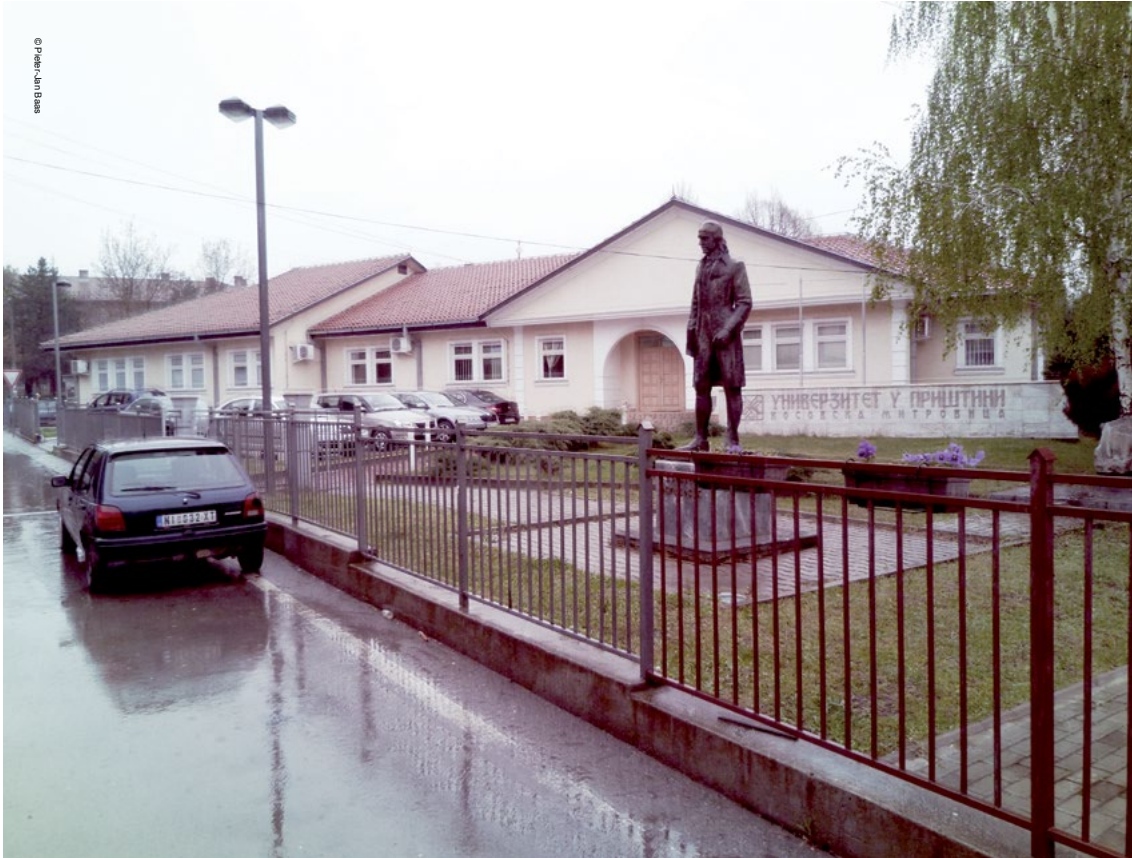
Prezenca e studentëve në universitet në veri të Mitrovicës ka ndikim pozitiv në ekonominë vendore dhe në atmosferën shoqërore në qytet.

politik edhe këtu luan një rol: disa shtëpi mediale në gjuhën serbe në Kosovë janë në pronësi dhe menaxhohen nga konglomeratët nga Serbia, të cilët shpesh kanë lidhje të drejtpërdrejta me partitë politike ose politikanët. Një numër i serbëve e kuptojnë se mjetet e tilla të informimit janë të censuruara. Sidoqoftë, -edhe media lokale është po ashtu e dëmtuar: informatat nga burime të besueshme është vështirë të mblidhen; sigurimi i fondeve për gazetarinë hulumtuuese vendore është detyrë e vështirë; lajmet e ndjeshme lokale përbëjnë rrezik për sigurinë e gazetarëve gjersa presioni dhe dhuna kundër korrespondentëve për shkak të publikimit të ndonjë informate të papërshtatshme, kalojnë pa u dënuar. Si rrjedhojë, shumë persona që mbledhin informata në Kosovë e censurojnë vetveten. 42 Raportet për vet-censurim, si në mesin e gazetarëve ashtu edhe te banorët e veriut, janë rritur dukshëm që nga fillimi i dialogut ndërmjet Serbisë dhe Kosovës.