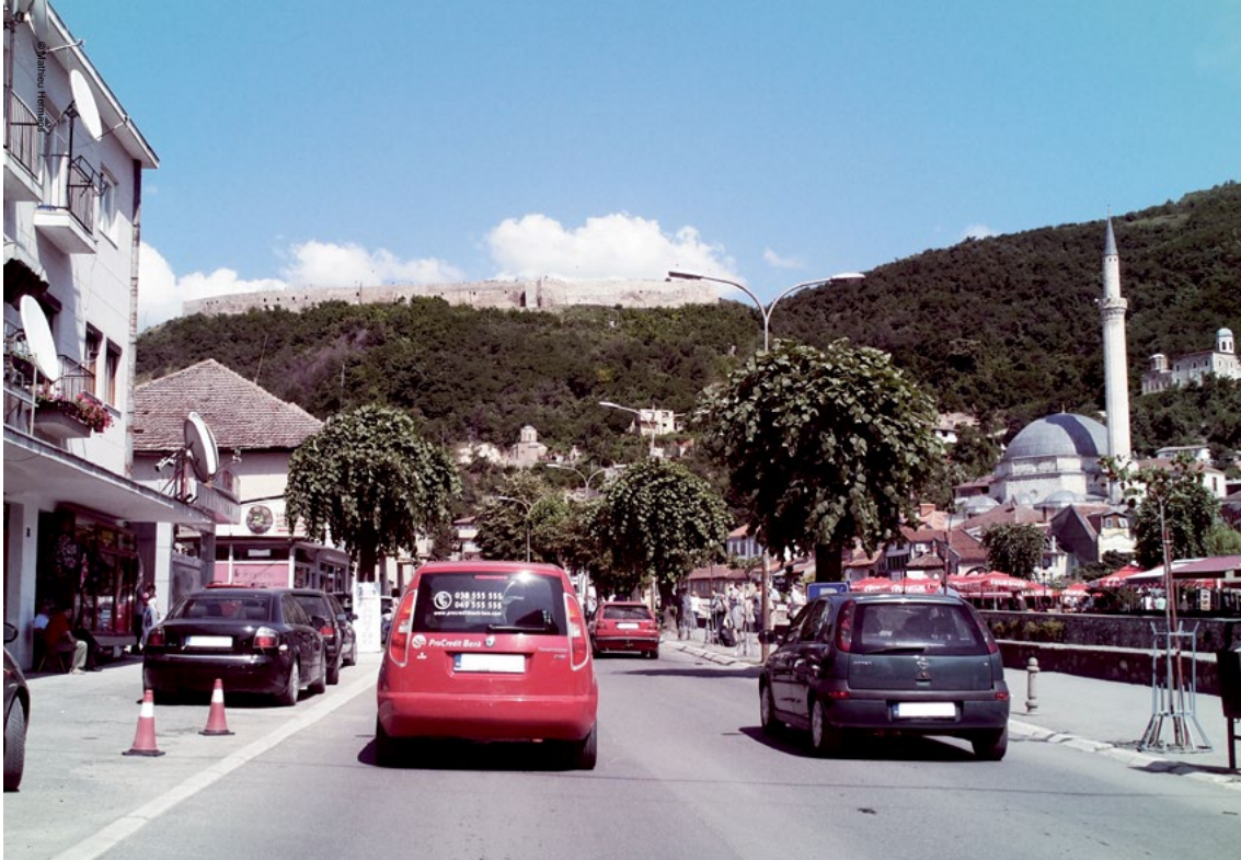
Prizren/Prizren në jug të Kosovës; shumica e Myslimanëve në Kosovë përkrahin sekularizmin (laicizmin).

të forta opozitare duke kundërshtuar edhe Bashkësinë Islame të Kosovës (BIK) si institucionin me më ndikim dheme pikëpamje politike dhe sociale të moderuar. LISBA e ka ngritur temperaturën në disa çështje të ndryshme. Në vitin 2014, LISBA keqinterpretoi një propozim të Kuvendit për uljen e zërit të ezanit (thirrjes myslimane për falje) e cila kishte për qëllim të përshtat zhurmën e ambientit me standardet e BE-së, e cila u interpretua si përpjekje për ta ndaluar ezanin—një fushatë e dezinformimit, që kishte për qëllim manipulimin e opinionit publik që ta drejtojë atë kundër këtij propozimi por dhe kundër BIK-ut, që punoi me Ministrinë e Mjedisit të Kosovës për të krijuar një projekt-ligj dhe për të vendosur standardet e transmetimit automatik të ezanit. 25 Edhe pse fundamentalizmi është shumë jopopullor brenda shumicës myslimane të Kosovës dhe LISBA ende mbetet një forcë e parëndësishme politike, aftësia e saj për të tërhequr vëmendje përmes provokimeve në një ambient ku mjetet e informimit nuk janë të sofistikuar dhe ku njerëzit kërkojnë rrugëdalje nga frustrimet e tyre, nuk duhet neglizhuar dhe veprimet e saj duhet të përcillen me kujdes. Pa një përpjekje të konsoliduar nga liderët politikë kosovarë dhe partnerët e tyre ndërkombëtar për përforcimin e sekularizmit kushtetues, ekziston rreziku i paraqitjes së tensioneve ndëretnike, kësaj here të nxitura nga ideologjitë sektare dhe dhuna e financuar globalisht, që ato shpeshherë sjellin. ♦