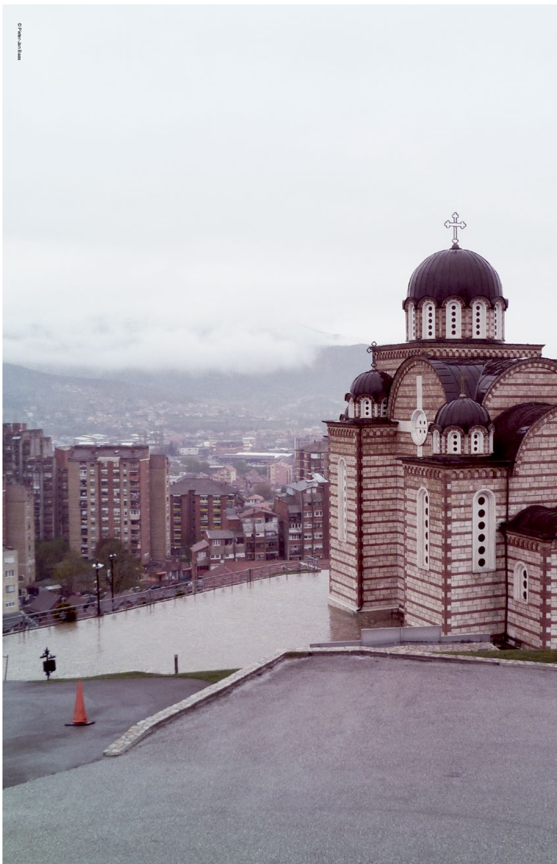
Një shikim mbi veriun e Mitrovicës: Integrimi i veriut së bashku me jo-stabilitetin në rajon mund të çojë vetëm një pjesë e komunitetit Serb të qëndrojnë në Kosovë.