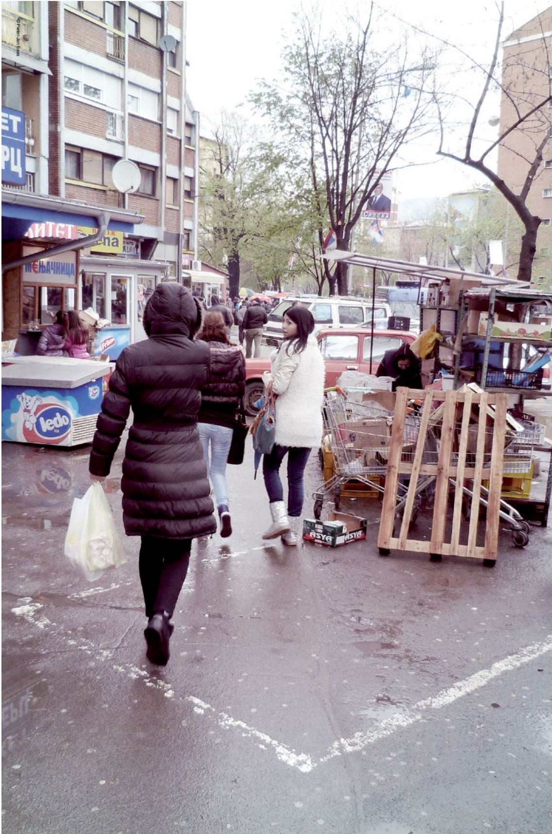
Njerëzit duke bërë pazar në veri të Mitrovicës; deri në vitin 2020 ata mund ta shohin Serbinë dhe Kosovën, përfshirë edhe veriun e Kosovës, duke përparuar me vendosmëri drejt anëtarësimit në BE.