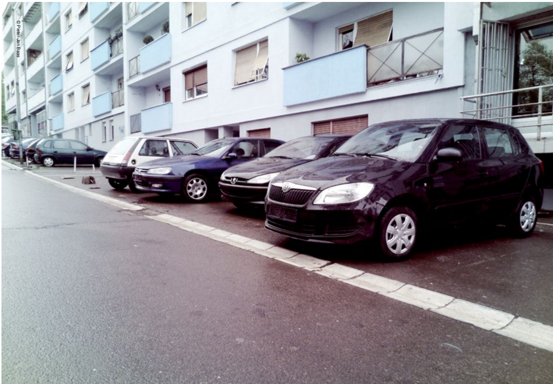
Veturat pa numrat e targave janë një shenjë e dukshme e sfidave me të cilat ballafaqohet sundimi i ligjit në veri të Kosovës.

respektimin e ligjit dhe mund të jetë një pikë kthese për sundimin e ligjit në veri, por për një gjë të tillë nevojitet përkrahja publike nga Serbia dhe nga kryetarët e komunave me shumicë serbe. 7