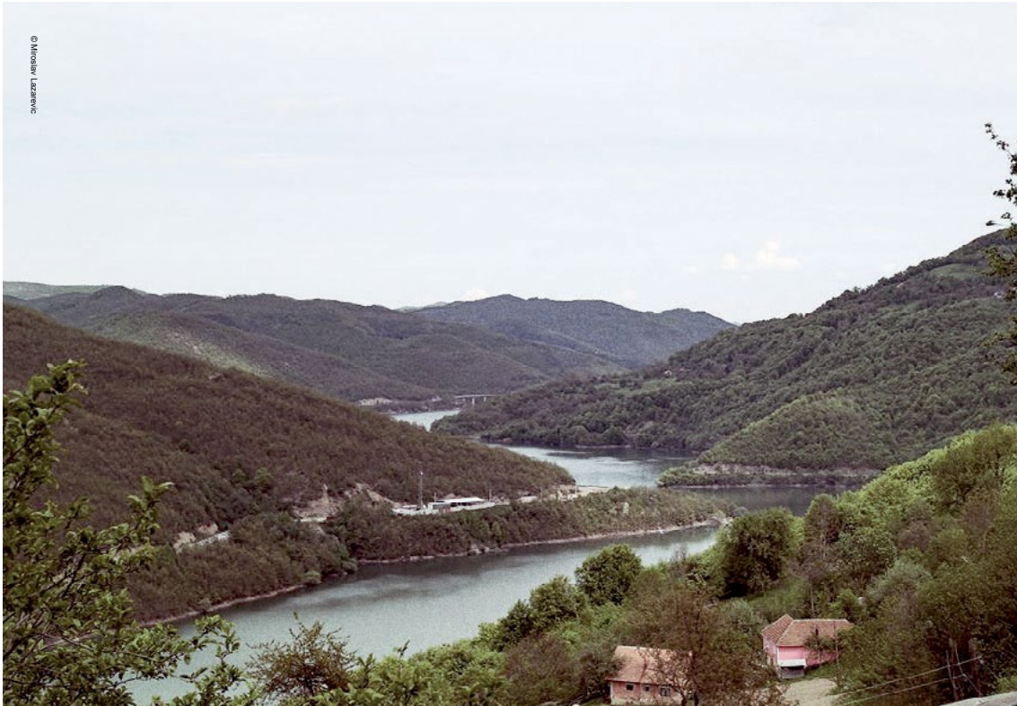
Liqeni Ujmani (Gazivoda) në Zubin Potok në veri të Kosovës është rezervuari kryesor i ujit për Kosovë.

Sfidat që lidhen me furnizimin me ujë të pijshëm përfshijnë sasinë e përgjithshme të ujit në dispozicion, integritetin dhe gjendjen e sistemit të gypave (bartja e ujit nëpër gypa po rezultojnë me humbje të mëdha për shkak të rrjedhjeve) si dhe cilësinë e ujit të pijshëm. 30 Rekonstrukcioni i ujësjellësit po trajtohet si investim me prioritet nga donatorët e BE-së, përmes instrumenteve të tyre të financimit, por bie në sy një investim shumë i vogël në infrastrukturën e ujësjellësit nga Qeveria e Kosovës. 31 Përkundër përpjekjeve të BE-së për ta përmirësuar gjendjen në furnizimin me ujë të pijshëm, sektori i ujit në Kosovë vazhdon të vuajë mungesën e investimeve edhe për shkak të mungesës së vullnetit politik të qeverisë: ajo ka dështuar ta bëjë çështjen e ujit prioritet të investimeve dhe nuk ka personel e as aftësit eknike brenda institucioneve të saj. Kosova mbetet shumë larg nga plotësimi i standardeve të BE-së për menaxhimin e ujit dhe burimeve të ujit. Sipas vlerësimeve të BE-së, Kosovës do t'i duhet të investojë minimum 60 milionë euro në vit për dhjetë vitet e ardhshme në mënyrë që të paktën t'i afrohet plotësimi të këtij standardi. 32 Nëse këto shërbime elementare nuk zgjidhen në të ardhmen, Kosova rrezikon të ballafaqohet me trazira. Meqenëse burimi më i madh i ujit gjendet në veri të Kosovës dhe i njëjti ndahet me Serbinë, këto probleme mund të ndikojnë në marrëdhëniet ndëretnike dhe raportet ndërmjet Serbisë dhe Kosovës.