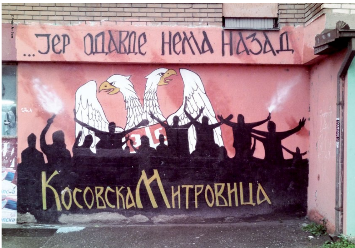
Grafitet me shqiponjën Serbe tregojnë për rezistencën Serbe në veri të Mitrovicës – "Mitrovica e Kosovës: Nuk ka rrugëdalje nga ky vend".